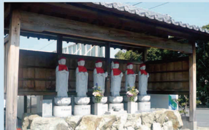
手入れの行き届いた素敵な霊苑です