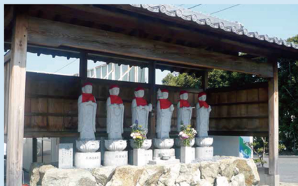
手入れの行き届いた素敵な霊苑です